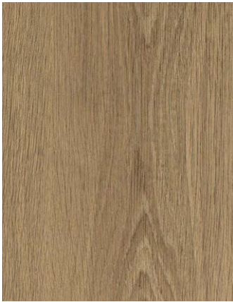
F470-9035 Turner Oak Amber Skai Woodec