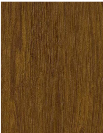
F436-3091 Sheffield Oak Kolonial STYLO Skai Cool Colors