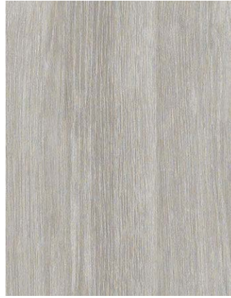
F470-3002 Sheffield Oak Alpine Skai Woodec