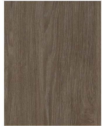
F436-3087 Sheffield Oak Brown STYLO Skai Cool Colors