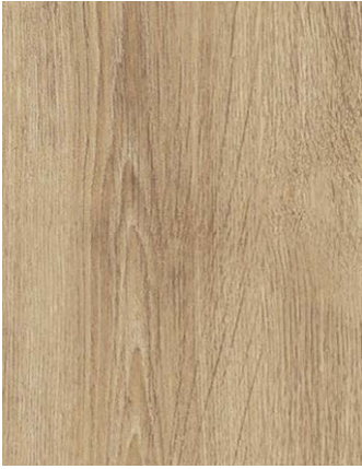
F470-3001 Turner Oak Malt Skai Woodec

Incluimos a continuación una selección de acabados Woodgrain.