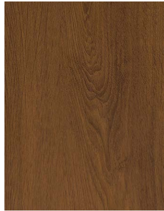
F476-9036 Turner Oak Walnut Skai Woodec