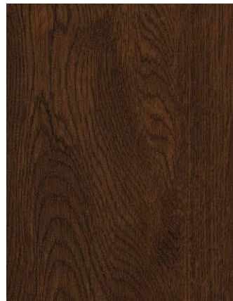
F436-2075 Eiche mocca TPRF Skai Cool Colors