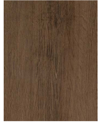
F470-3004 Turner Oak Toffee CC Skai Woodec