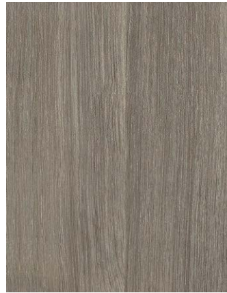
F436-3086 Sheffield Oak Grey STYLO Skai Cool Colors