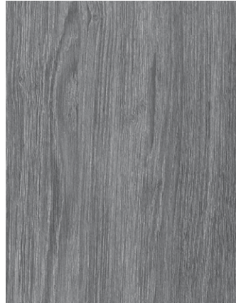
F470-3003 Sheffield Oak Concrete Skai Woodec