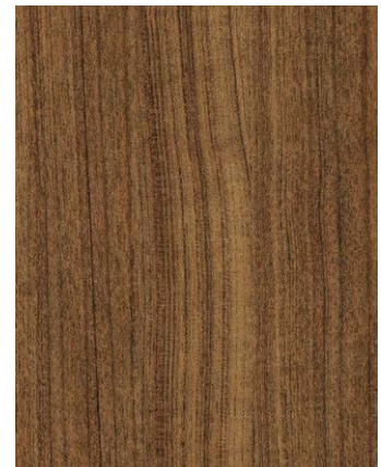
F436-3052 Teak Arte MIP Skai Cool Colors