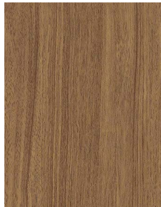
F436-3041 Noce Sorrento Natur Skai Cool Colors